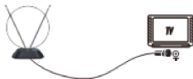
(рис. 2) Подключение через DVB-T2 приемник